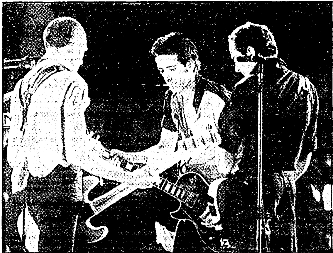
Il gruppo dei Clash, all'Arena, ore 21