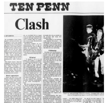
Facsimile of The Clash interview in Stavanger Aftenblad, 03/03/1984

"The Clash" is today considered a classic, and while much else has changed since 1977, the band's frontman Joe Strummer champions the record's rebellious content just as fervently today; three LPs ("London Calling", "Sandinista" and "Combat Rock"), lots of tours and fame later.