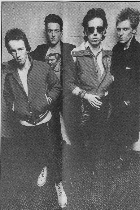
V.l.n.r.: Topper Headon, Joe Strummer, Mick Jones, Paul Simonon