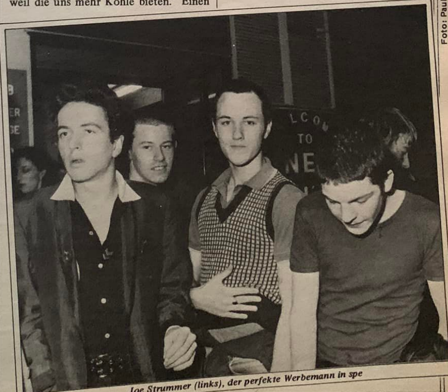
Joe Strummer (links), der perfekte Werbemann in spe

Die erste Clash-LP war die Punk-Platte schlechthin, da kamen selbst die Sex Pistols nicht mit. Jedoch niemand,