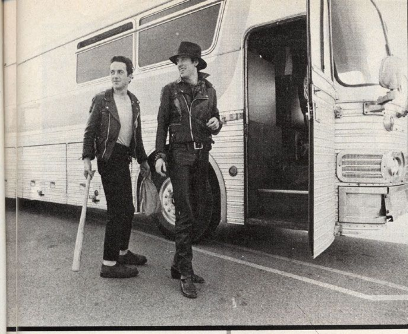
Strummer et Jones

commencé doucement et vers le milieu, on a chaque fois obtenu un quotient d'excitation plus que raisonnable, si j'ose dire. En fait au début ils sont vraiment choqués, ils ne savent pas à quoi s'attendre. Il faut bien comprendre que nous sommes les premiers à avoir fait une vraie tournée là-bas. Alors on les a remués et ils s'y sont mis graduellement, alors qu'ici, c'est la folie dès le début. Pour nous c'était un inhabituel et dur travail, car ils se sont assis par terre en arrivant.