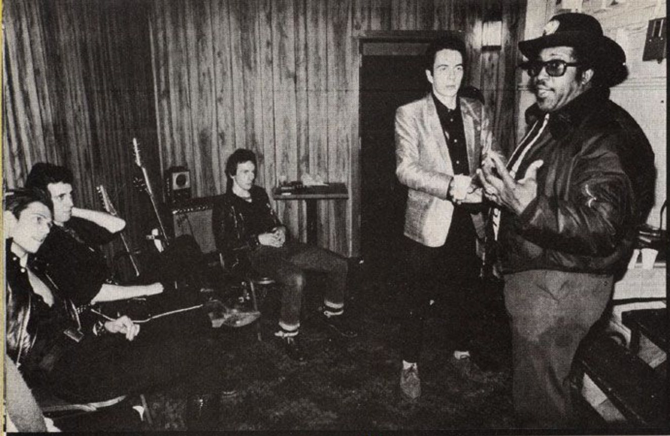
En coulisse avec Bo Diddley