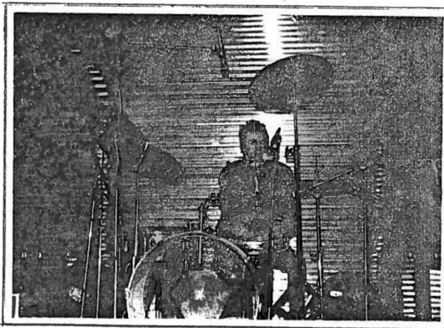
LILLE NICKY HEADON SOM MAN SÄLLAN SER PÅ KONserter.