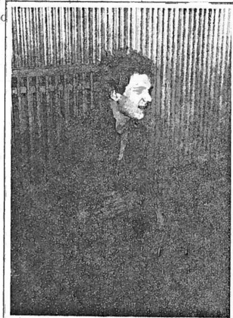
PAUL SIMENON UNDER INTERVJUN.

JOE STRUMMER: Jo, dom är skitbra och Patti Smith Group också.